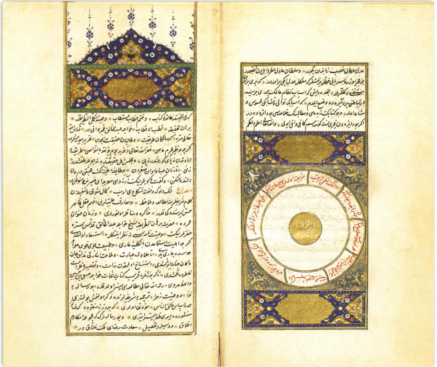
Ahlâk-ı Alâî, Alaeddin Ali b. Emrullah Kınalızâde. TY 4112. İstanbul Üniversitesi Kütüphânesi.

Hz. Peygamber devlete manevî şahsiyetini (tüzel kişilik) kazandırmış ve devleti müstakil bir kurum olarak kendi şahsiyetinden ayırmıştır. Devletin hazînesi ile kendi şahsî malını birbirinden ayırması bunun somut bir yansıması olarak kendisini