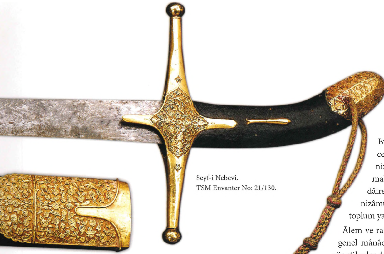
Seyf-i Nebevî. TSM Envanter No: 21/130.