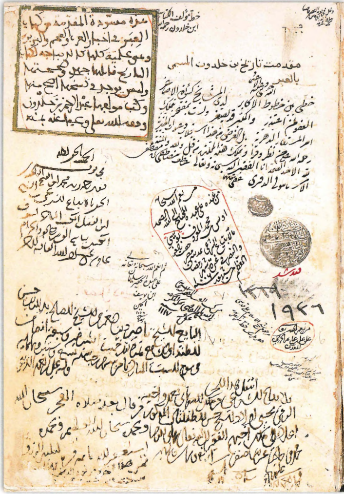
Süleymâniye Kütüphanesi, Âtîf Efendi, 1936 numarada kayıtlı bulunan Mukaddime nüshasının mühürlü sahifesi.

Taht. T.C. Kültür ve Turizm Bakanlığı Ankara Etnografya Müzesi.